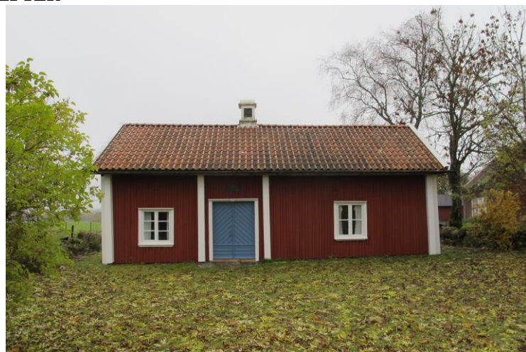
MV_Karlu12_Upptorp 2_5_2015-10-22 (3)