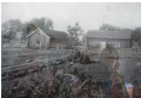
Foto från 1800-talets slut eller 1900-talets början, fotot finns i släktstugan

F.d mangårdsbyggnad belägen norr om landsvägen i Upptorps by strax öster om Ods kyrka. Fastigheten omges av ekonomibyggnader på båda sidor. Väster om byggnaden ligger Upptorp Storegården, vars mangårdsbyggnad före 1909 stod intill släktstugan. Se bild. På häradsekonomska kartan från 1890 ser man båda husen ligga samlade.